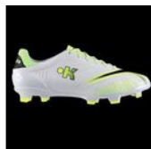
Chaussures de Football Kipsta Agility 700 Pro