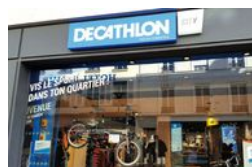
Top 30 des enseignes les mieux perçues par les non-clients