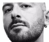
Demna Gvasalia Directeur artistique des collections de la maison Balenciaga