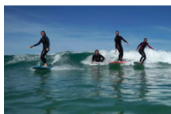
Decathlon cherche ambassadeurs pour nouvelle marque de surf