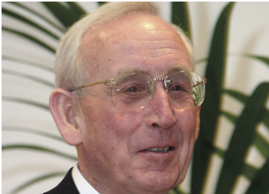
Gérard Mulliez passe de la troisième place à la quatrième place parmi les 500 plus grosses fortunes françaises...et s'est enrichi de 15% en un an.